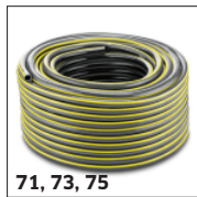
71, 73, 75