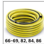
66-69, 82, 84, 86