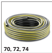
70, 72, 74