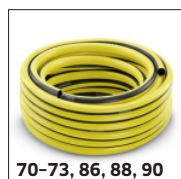
70-73, 86, 88, 90