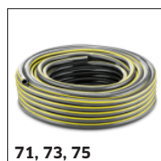
71, 73, 75