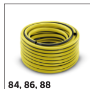
84, 86, 88