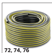
72, 74, 76