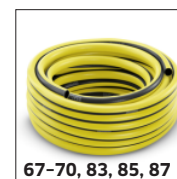
67-70, 83, 85, 87