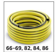
66-69, 82, 84, 86